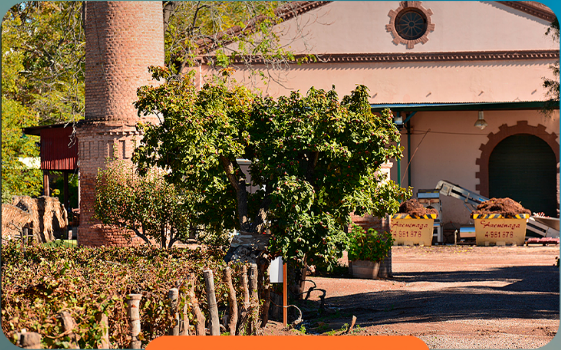
📍 BODEGA LAGARDE