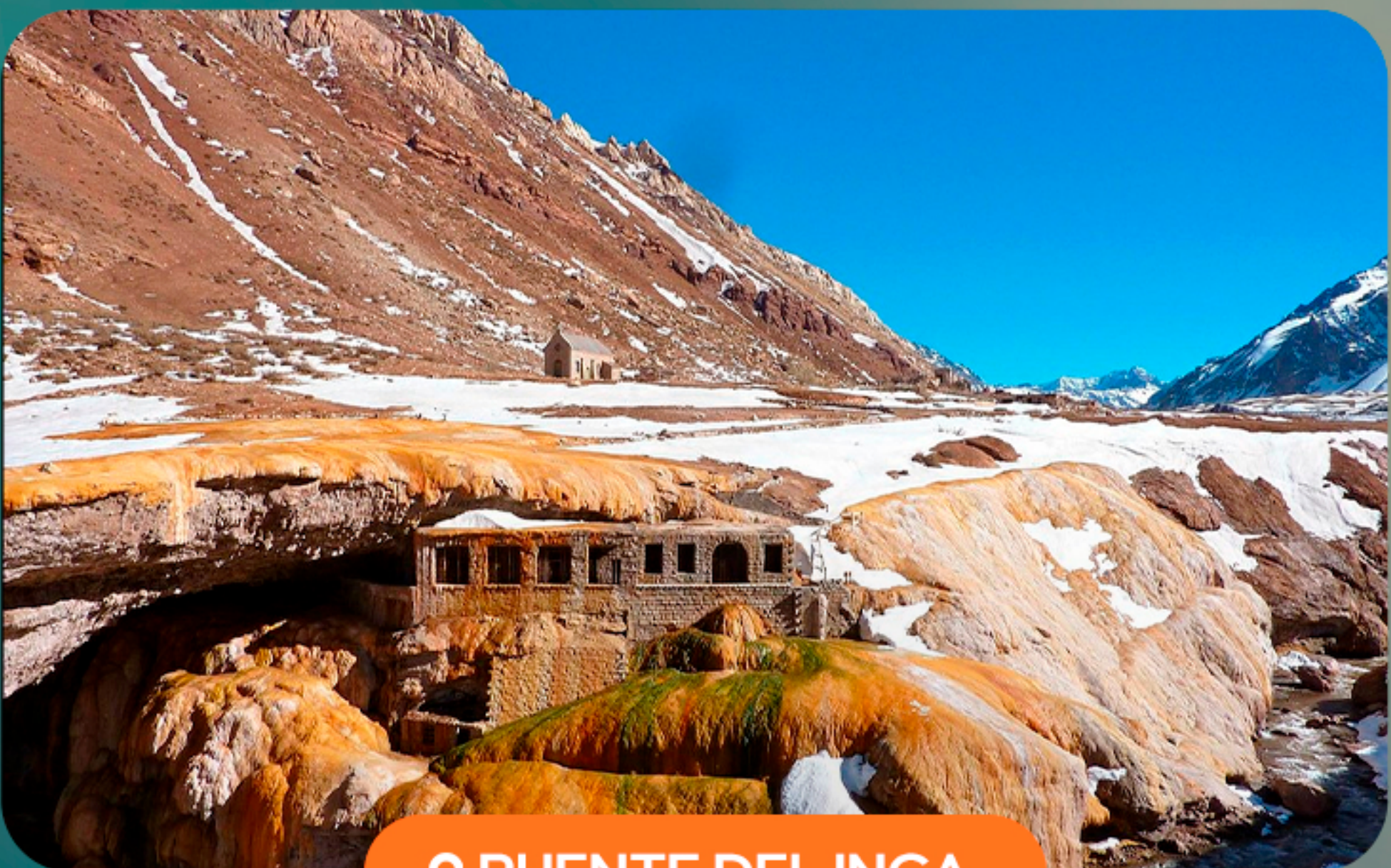
📍 PUENTE DEL INCA